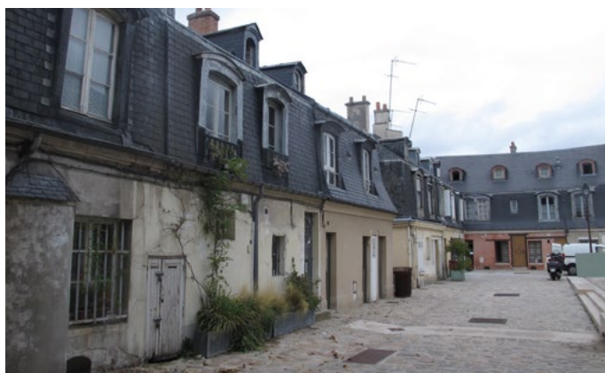
Carré St-Louis Versailles