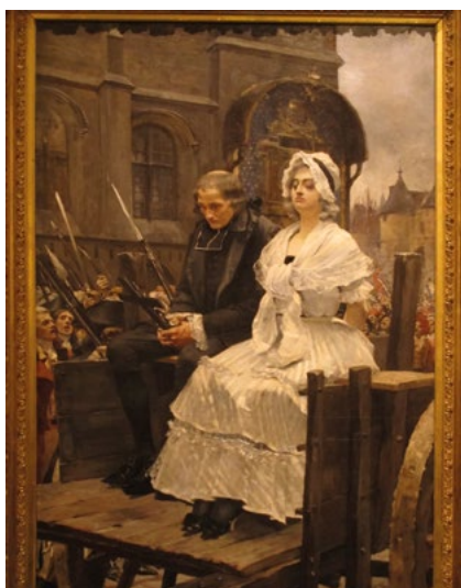
Marie-Antoinette vers l'échafaud