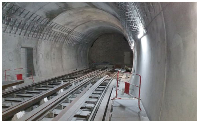
Chantier extension ligne 4 du métro