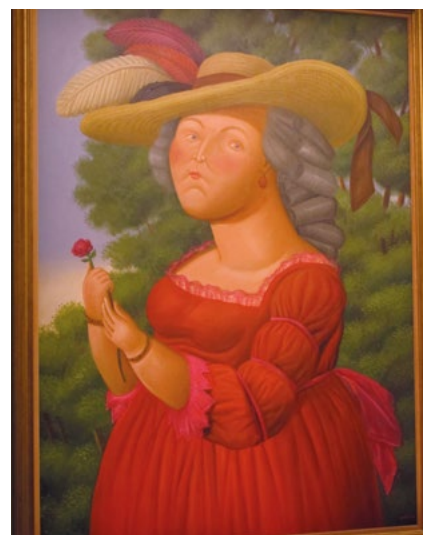
Marie-Antoinette par Botero