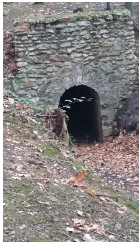
Réseau hydraulique en forêt de Meudon

Lorsque le rendez-vous est prévu sur le lieu de visite, les personnes qui souhaitent faire le trajet en groupe peuvent se renseigner auprès des permanences pour connaître les noms des participants et ainsi les contacter pour regroupement éventuel.