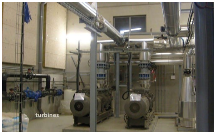
Centrale de géothermie de Villejuif