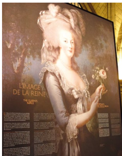
Marie-Antoinette à la rose