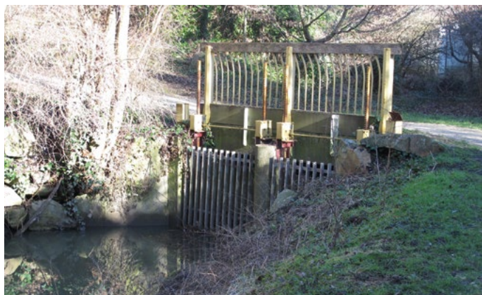
La Bièvre redécouverte à Antony parc des prés