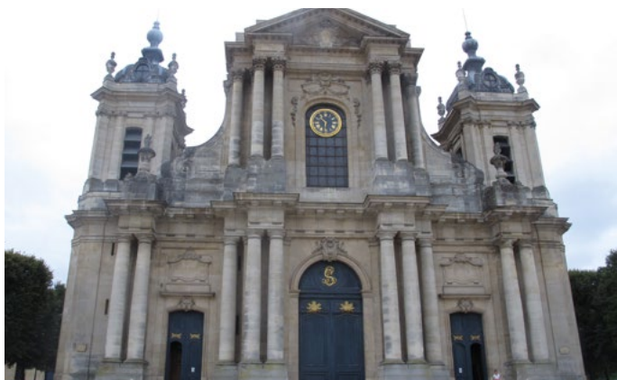
Cathédrale St-Louis de Versailles