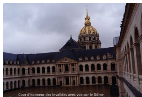
Cour d'honneur des Invalides