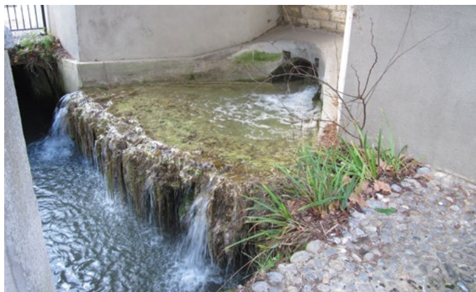
Déversoir des aqueducs du Loing et du Lunain à Cachan dans la bièvre